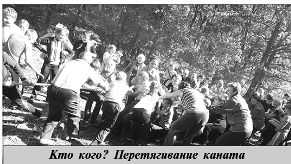
Кто кого? Перетягивание каната

конкурсы, например, музыкальные приветствие, перетягивание каната, бег с препятствиями и т.д. Большое удовольствие школьникам доставило разведение костра, приготовление обеда, установление палаток и др.