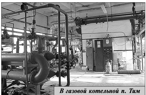
В газовой котельной п. Тим