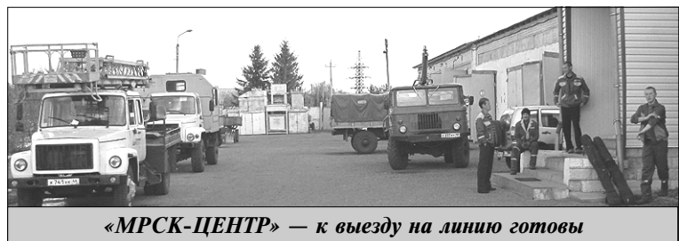
«МРСК-ЦЕНТР» — к выезду на линию готовы

подведомственных учреждений. Особое внимание необходимо уделить состоянию газовой котельной и линий теплопередачи, модернизации систем теплоснабжения, что должно привести к энергосбережению и повышению энергоэффективности. Один из примеров — это ус-